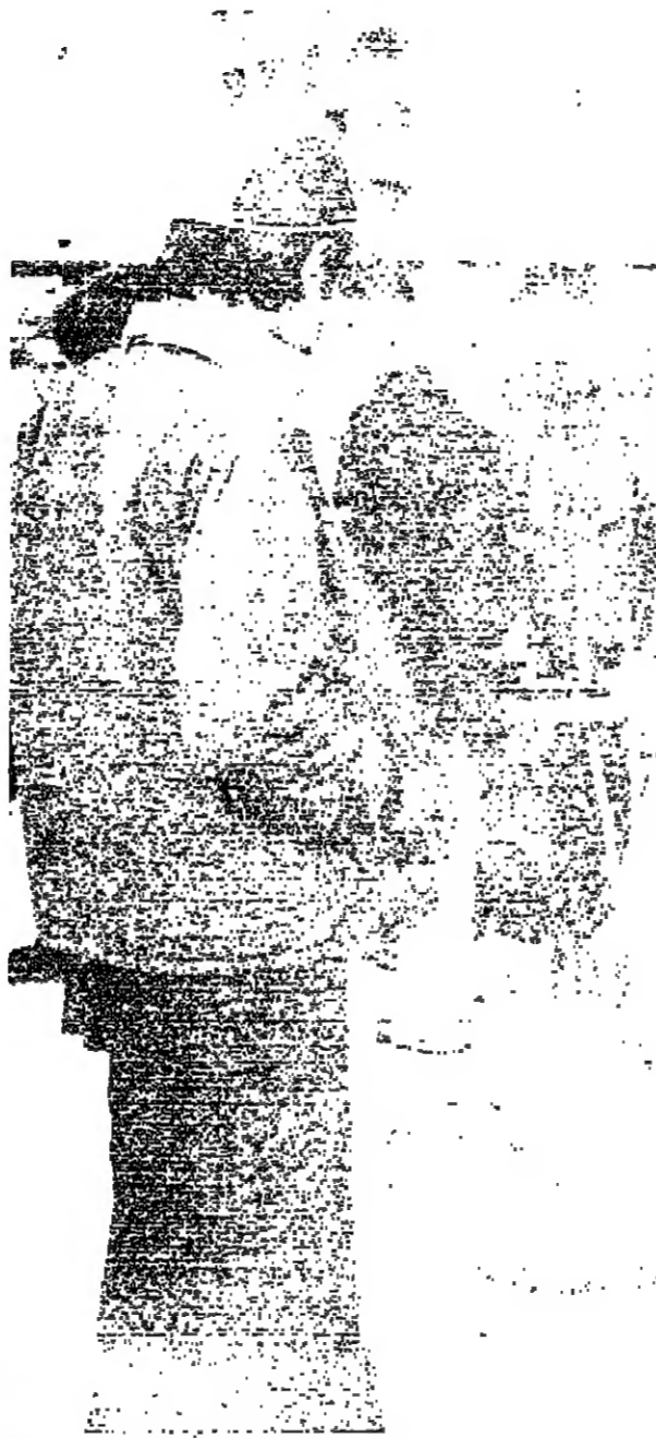
( تصوير حسب شما )